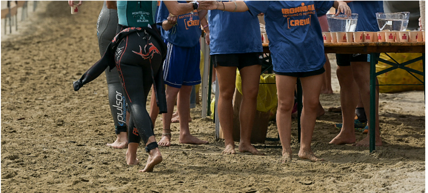
Foto (utilizzo editoriale gratuito con menzione dei credits fotografici):