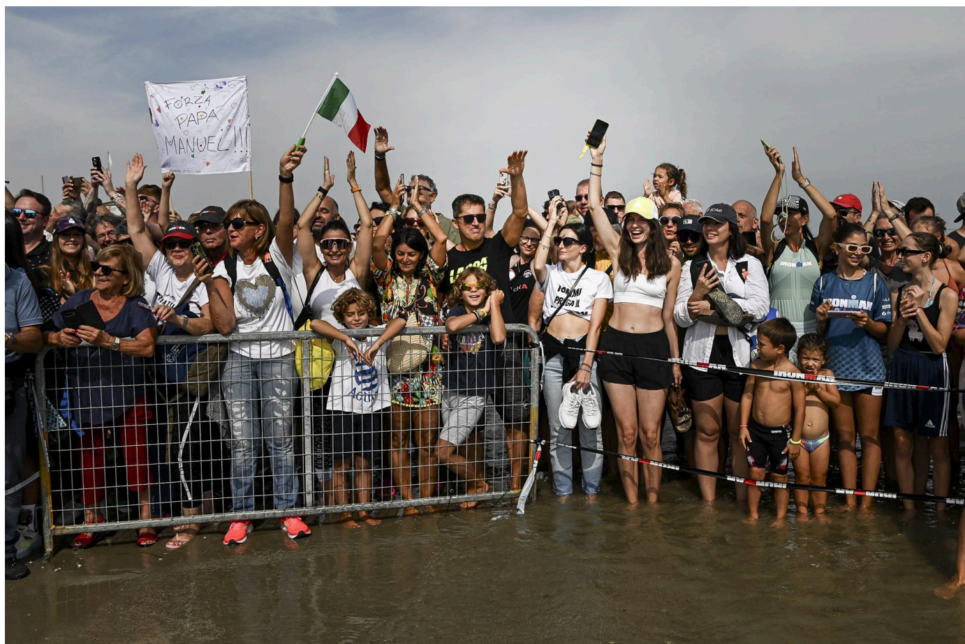
Foto (utilizzo editoriale gratuito con menzione dei credits fotografici):