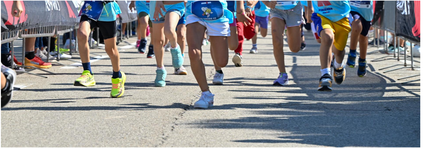
Foto (utilizzo editoriale gratuito con menzione dei credits fotografici):