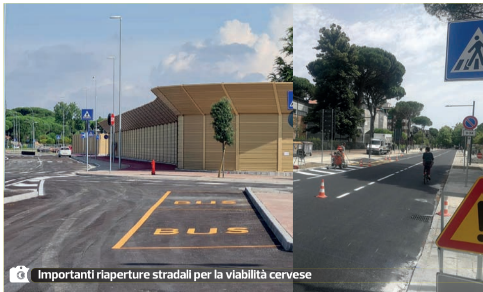
Importanti riaperture stradali per la viabilità cervese

le Artusi di collegamento fra via G. Di Vittorio e via Martiri Fantini che, costeggiando l'Istituto alberghiero, costituisce il completamento di via Attilia Angelini. I lavori, eseguiti dai privati nell'ambito del Piano urbanistico attuativo, hanno visto, oltre alla realizzazione della nuova arteria stradale, la sistemazione del parcheggio di piazzale Artusi con oltre 100 posti auto, che si integrano con l'area di sosta da 80 stalli, realizzata nell'immediata adiacenza dal Comune circa due anni fa. In queste settimane sono in corso il completamento degli allacci alle reti Hera e