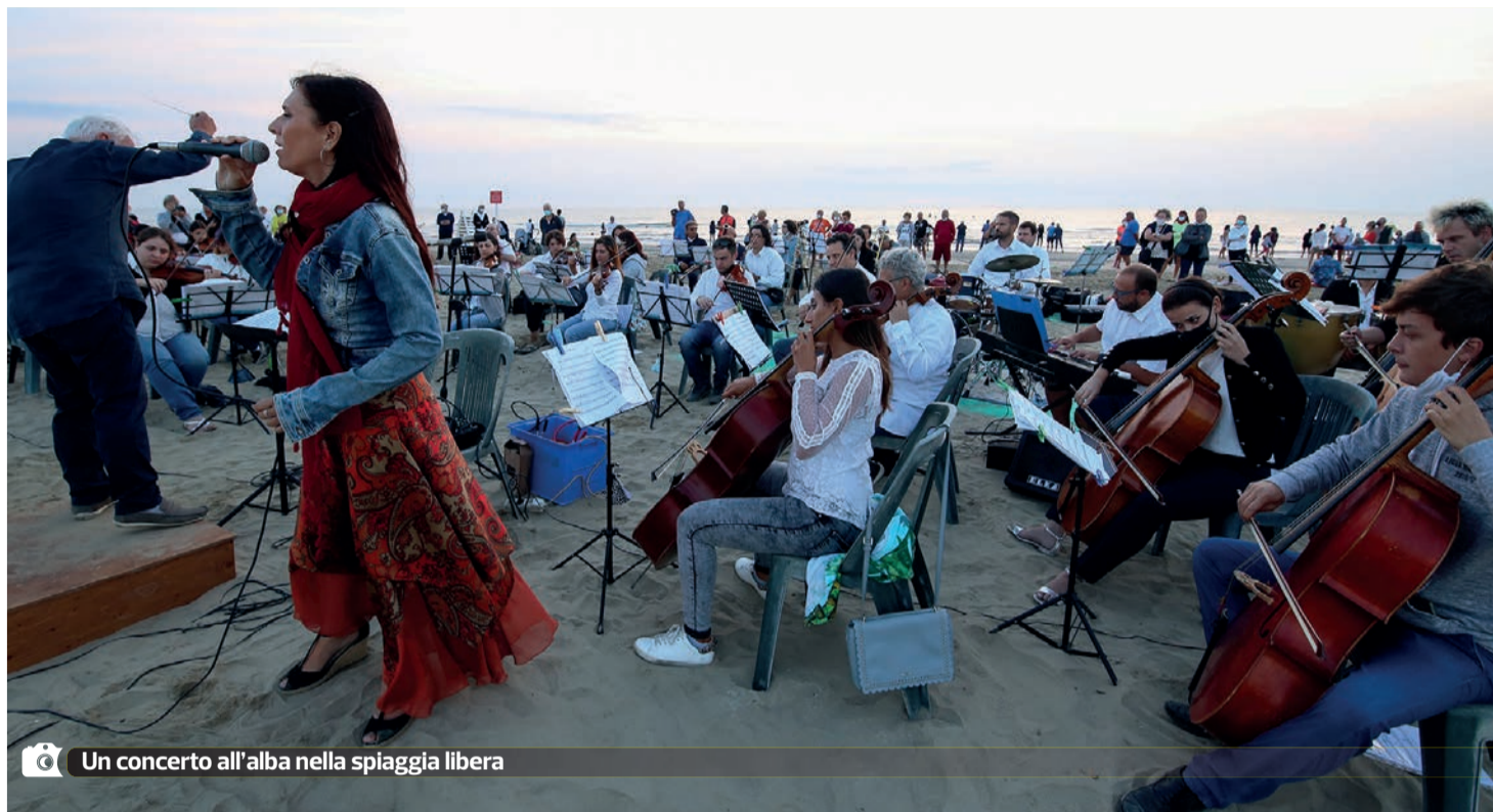
Un concerto all'alba nella spiaggia libera

«D'Agosto moglie mia non ti conosco...»; se questo detto un tempo aleggiava nell'aria estiva oggi le mogli si trovano ben salde al fianco dei mariti e la coppia gode insieme della magia dell'estate e dei vari eventi che mare, pinete, saline e stelle cadenti rendono ancora più magici. E' nei mesi estivi che Cervia e la natura da cui è circondata si offrono in tutto il loro splendore. La spiaggia, il fresco della pineta e gli antichi luoghi del centro storico diventano allora paesaggi perfetti per appuntamenti culturali di ogni tipo, per concerti, incontri letterari, o semplicemente per una passeggiata, per apprezzare il mare o godere di un tramonto mozzafiato nelle saline. Alcuni luoghi storici della città accolgono eventi e spettacoli di grande richiamo, come ad esempio il Magazzino del Sale che si offre come splendida coreografia per le opere artistiche della mostra "Le Passioni dei Collezionisti: Da Bertelli a Cattelan", che resterà visitabile fino al 20 agosto e alla quale è dedicato l'articolo a pagina 9. Per il secondo anno, inoltre, piazzale dei Salinari ospiterà la ras-