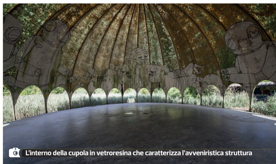
L'interno della cupola in vetroresina che caratterizza l'avveniristica struttura

chiudere definitivamente nel 1975 a seguito di un incendio, che fortunatamente ha lasciato intatta la grande cupola. Da quel momento la discoteca è rimasta in stato di abbandono, mantenendo inalterato il suo fascino. E forse è stato proprio questo ad