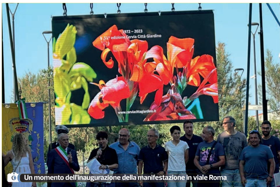
Un momento dell'inaugurazione della manifestazione in viale Roma