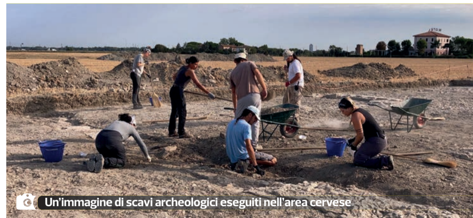
Un'immagine di scavi archeologici eseguiti nell'area cervese

alla disponibilità dei proprietari dei terreni, le indagini all'area del Prato della Rosa. Se si escludono 2 saggi eseguiti negli anni Sessanta, il sito risulta ancora per la maggior parte ignoto, ma nell'immaginario collettivo locale il Prato della Rosa è l'antico insediamento di Ficocle. Con l'avvio di nuovi saggi di scavo archeologico proprio in questo luogo le ricerche potrebbero portare novità sull'origine di Cervia e sull'effettiva natura e localizzazione di Ficocle, che ancora oggi sono avvolte nel mistero e in un alone di leggenda. Gli scavi inizieranno in agosto. Per il 7 agosto è prevista la presentazione dei risulta-