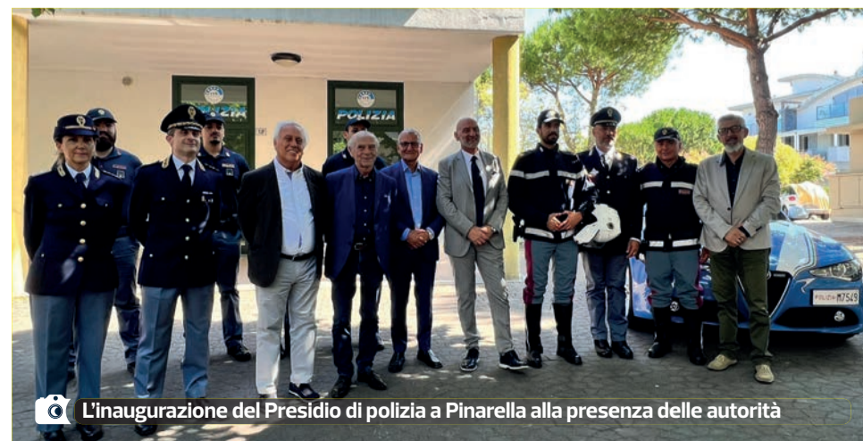
L'inaugurazione del Presidio di polizia a Pinarella alla presenza delle autorità

Quest'anno addirittura il posto di polizia a Pinarella è stato attivato una settimana prima rispetto all'anno scorso, allungando così il periodo di apertura”.