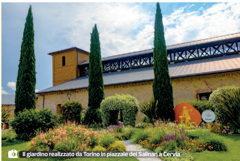
Il giardino realizzato da Torino in piazzale dei Salinari a Cervia

ma anche ispirati dalle composizioni e installazioni uniche e geniali che ogni anno continuano ad ornare le aree verdi della città. I risultati di questa crescita hanno portato Cervia a meritare a pieno titolo l'appellativo