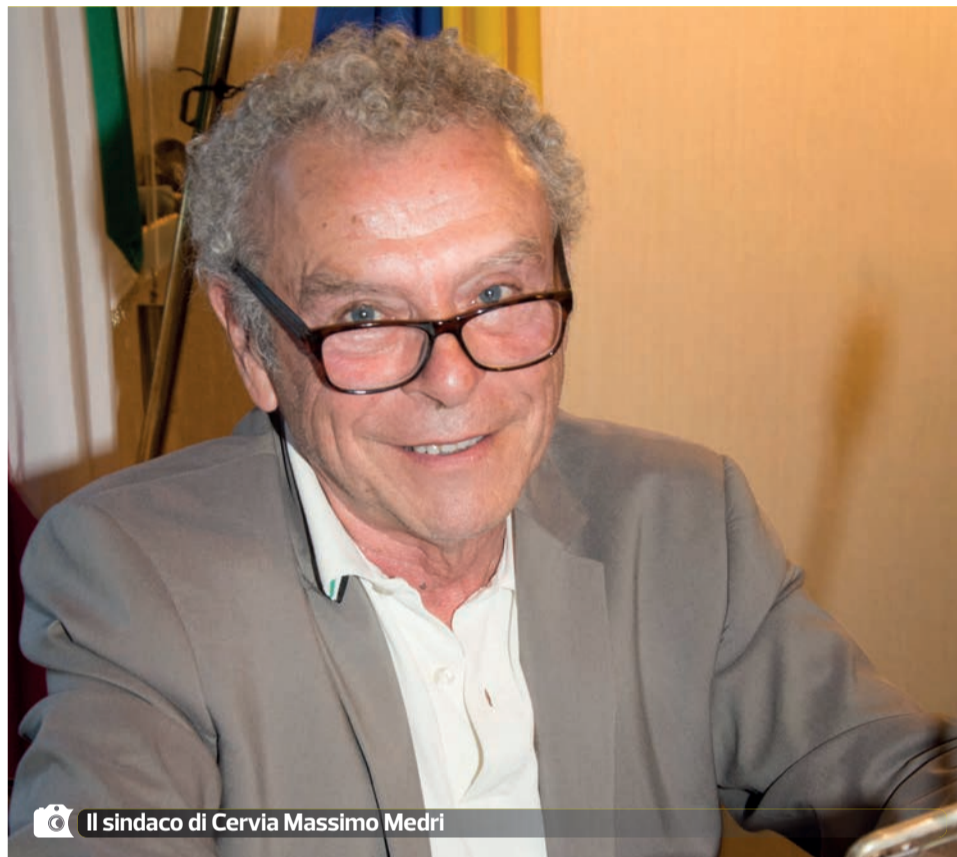
Il sindaco di Cervia Massimo Medri

“Negli anni abbiamo sempre posto molta attenzione al tema della sicurezza, intervenendo in modo tempestivo sulla città, tanto da essere riusciti in pochi anni ad arginare alcuni fenomeni di malcostume, che durante la stagione estiva si manifestano a Cervia, come da ogni parte del nostro Paese. Siamo consapevoli che dobbiamo mantenere alta l'attenzione e la vigilanza e anche su questo fronte lavoriamo insieme alle Forze dell'ordine. Per l'estate in corso è stata confermata l'impostazione dello scorso anno, con il coordinamen-