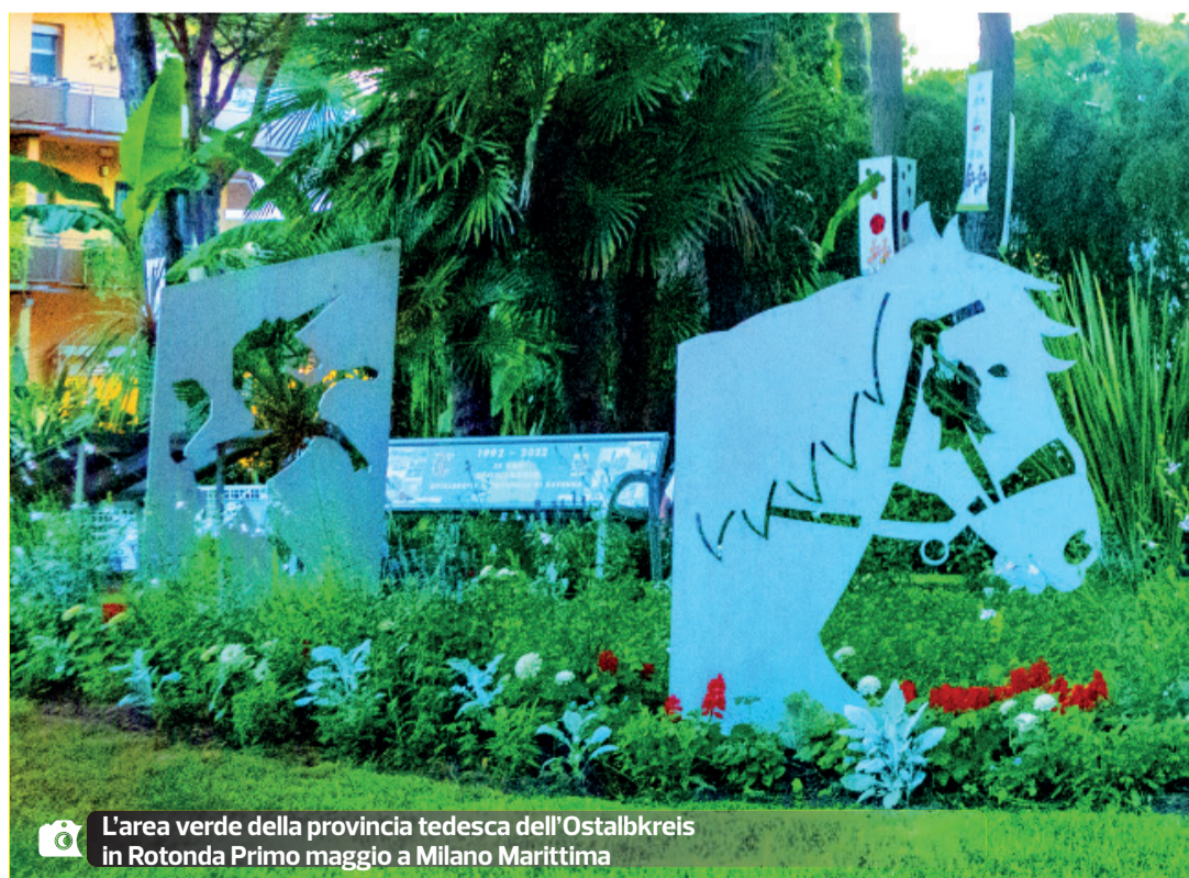
L'area verde della provincia tedesca dell'Ostalbkreis in Rotonda Primo maggio a Milano Marittima