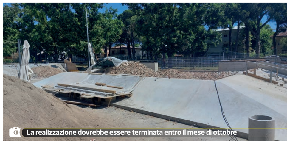
La realizzazione dovrebbe essere terminata entro il mese di ottobre