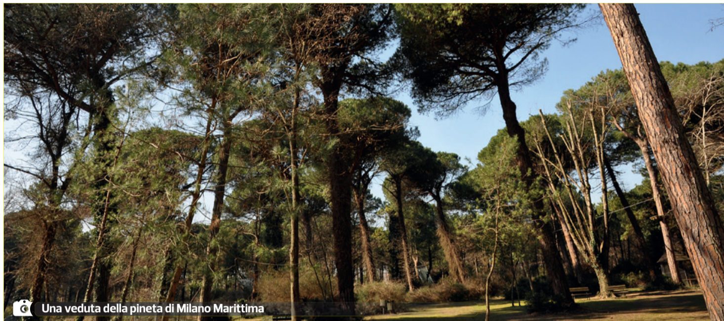
Una veduta della pineta di Milano Marittima

Attivo anche il sistema per la precoce individuazione di focolai di incendio. Una rete di sensori installati