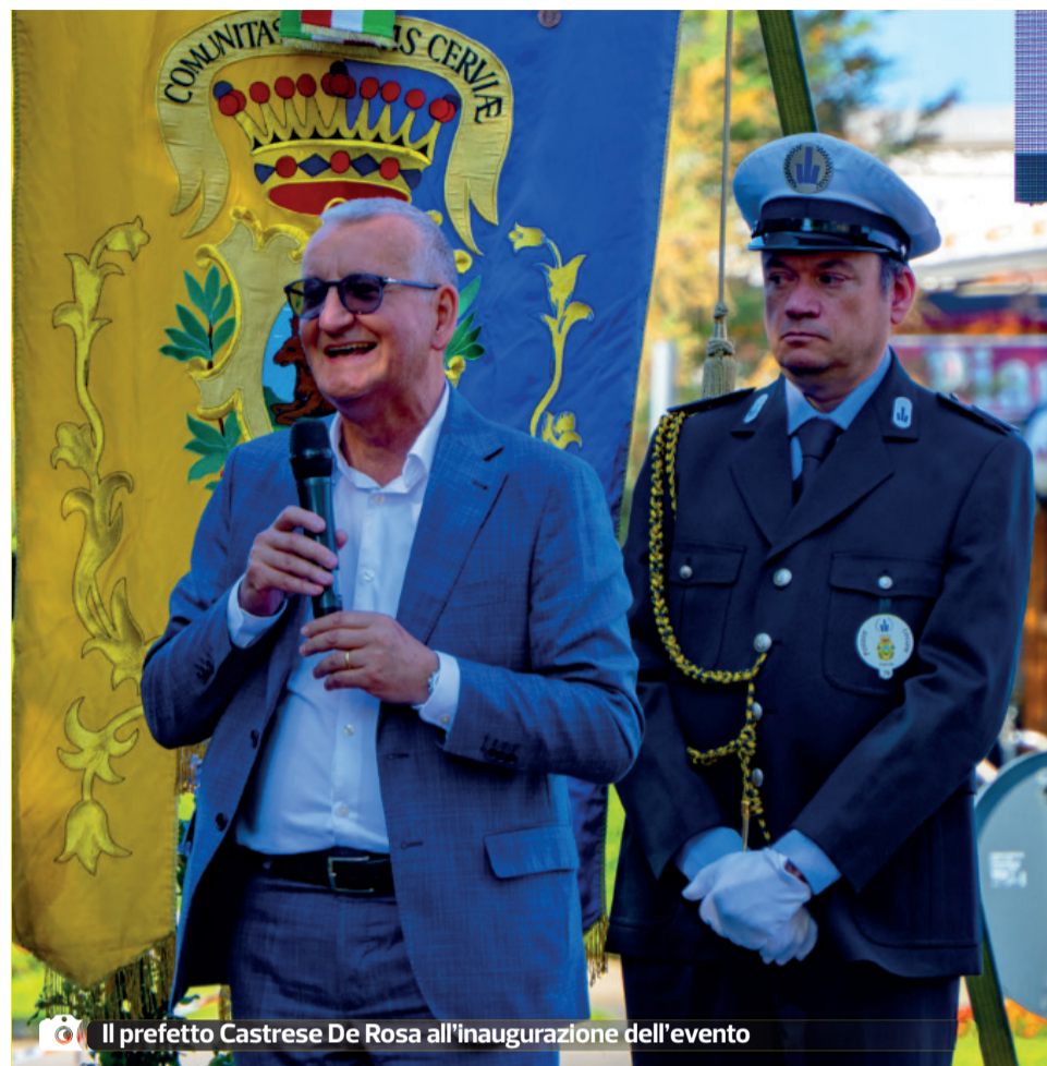
Il prefetto Castrese De Rosa all'inaugurazione dell'evento