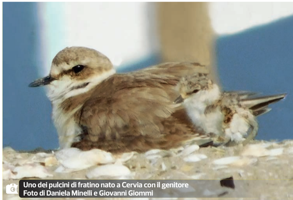
Uno dei pulcini di fratino nato a Cervia con il genitore

Come detto, il fratino è una specie a rischio estinzione e particolarmente protetta: in Emilia-Romagna nel 2000 erano registrate 200 coppie, mentre oggi se ne contano circa 40.