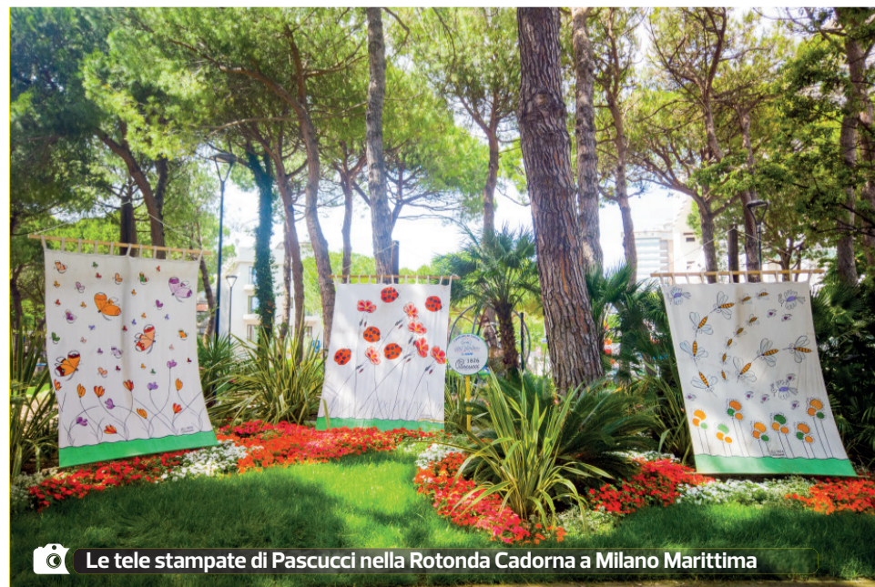
Le tele stampate di Pascucci nella Rotonda Cadorna a Milano Marittima