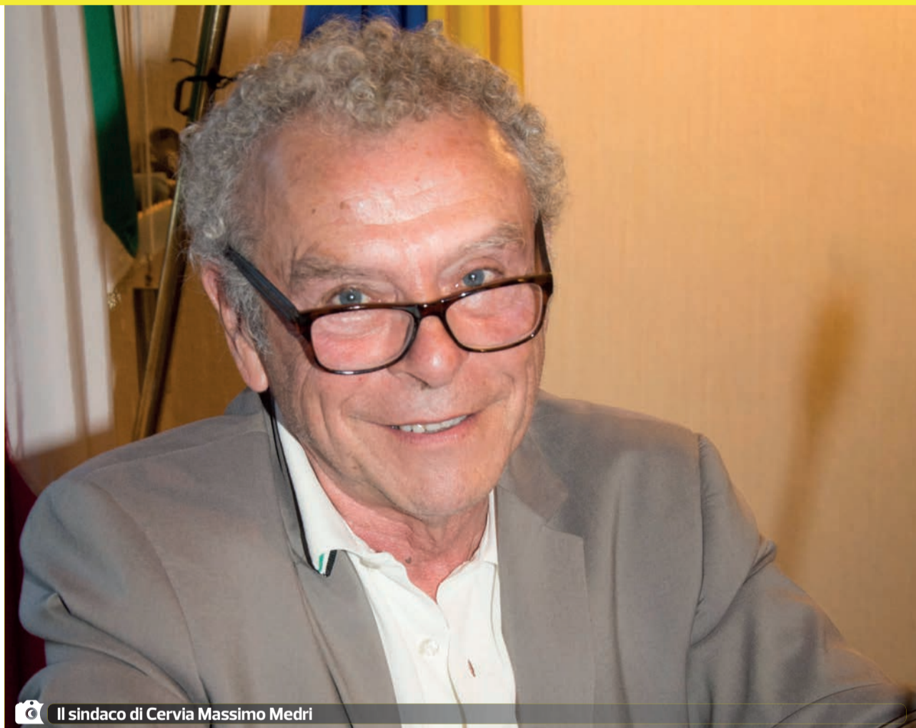
Il sindaco di Cervia Massimo Medri