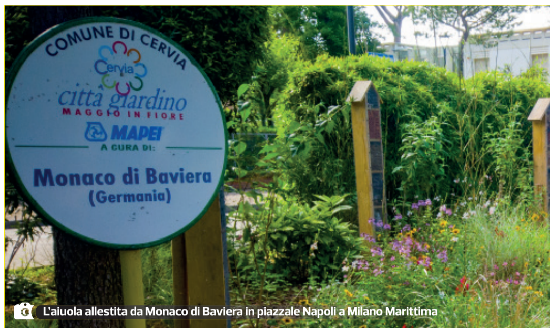
L'aiuola allestita da Monaco di Baviera in piazzale Napoli a Milano Marittima