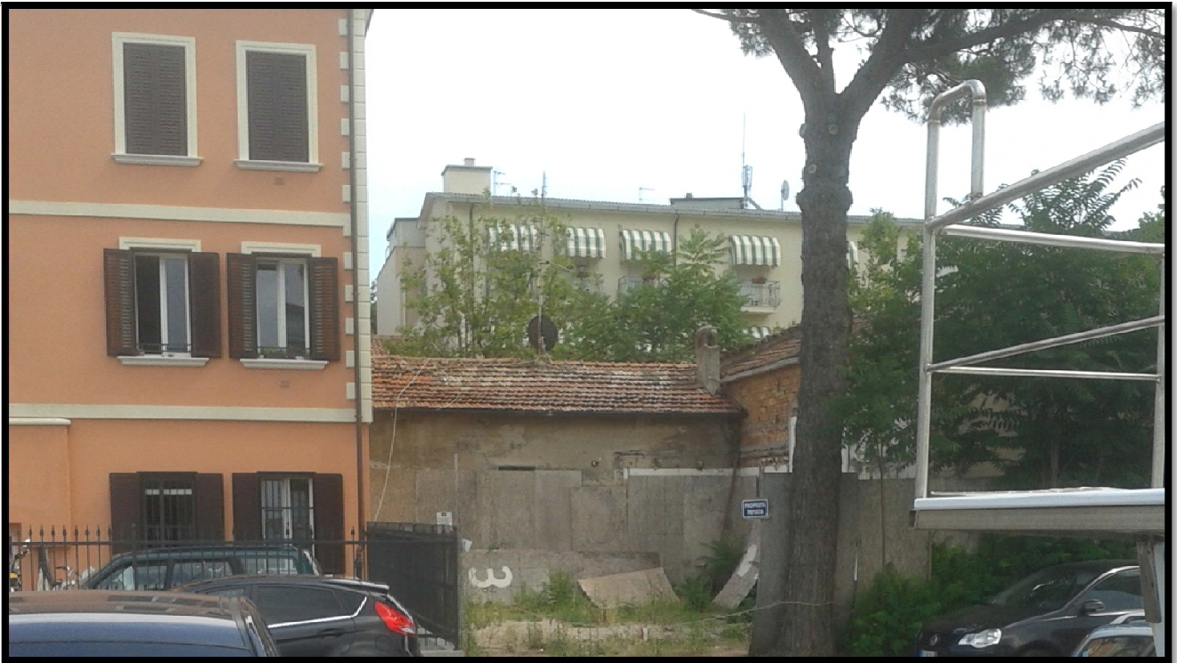
Immagine fotografica nr. 03: vista del retro della proprietà