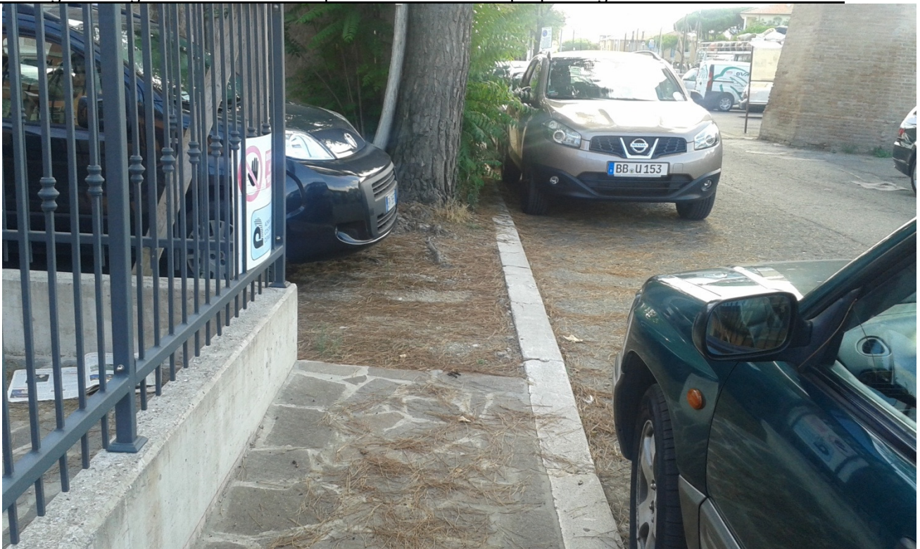
Immagine fotografica nr. 06: marciapiede sul retro della proprietà già dotato di cordolo in c.a.