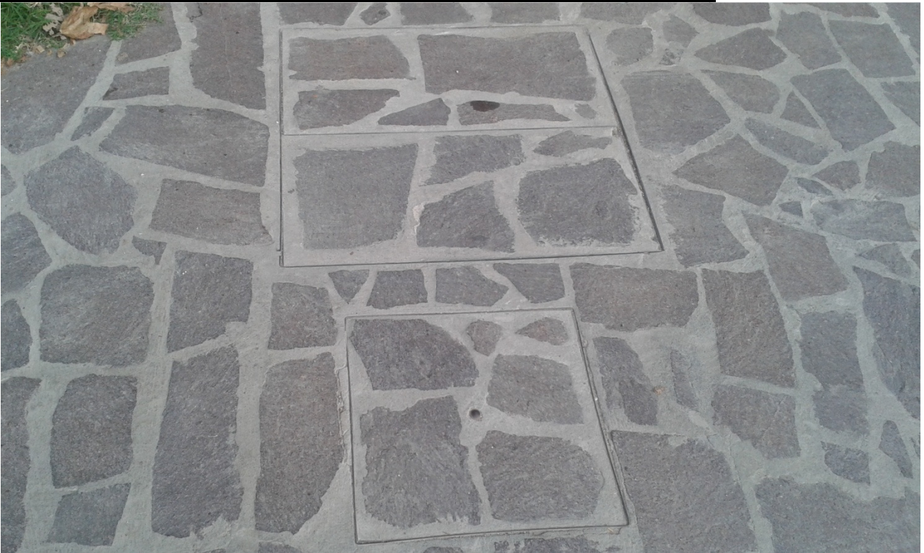
Immagine fotografica nr. 08: rete fognaria già presente come citato sopra, nella pavimentazione in opus incertum realizzata sul viale Nazario Sauro (vedere anche fotografia n.5)