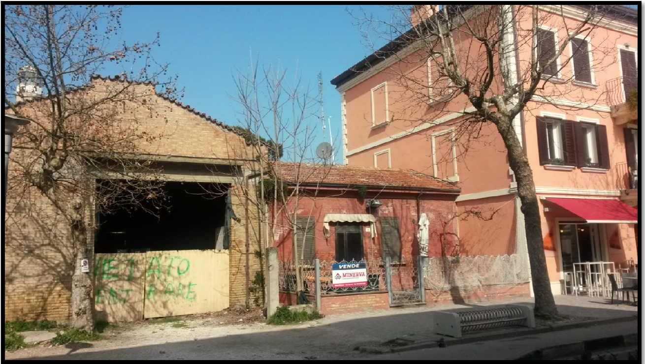
Immagine fotografica nr. 01: vista frontale su via Nazario Sauro