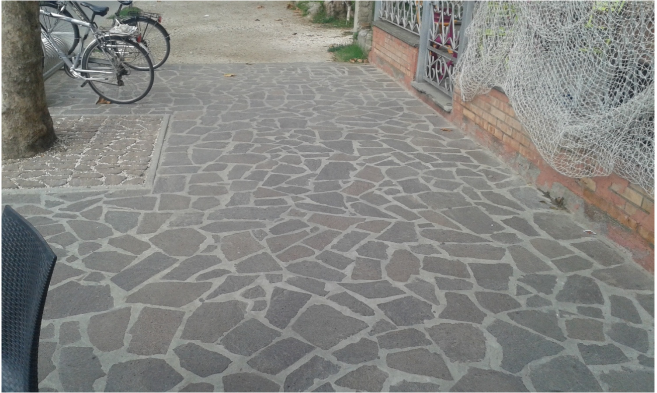
Immagine fotografica nr. 05: particolare della pavimentazione già realizzata fronte Viale Nazario Sauro, con tipologia opus incertum in porfido, discontinuità con la pavimentazione caratteristica del Borgo Marina esistente.