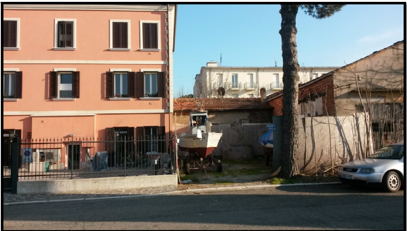
Immagine fotografica nr. 04: altra vista del retro della proprietà, più lontana che evidenzia maggiormente il contesto dell'intervento