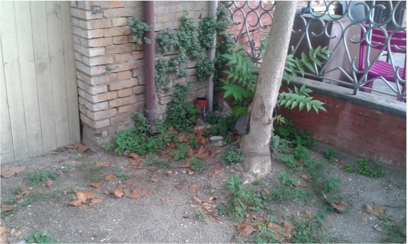
Immagine fotografica nr. 07: presenza di predisposizione alle varie utenze, realizzate al momento della ristrutturazione dell'edificio adiacente del sottosettore AD7