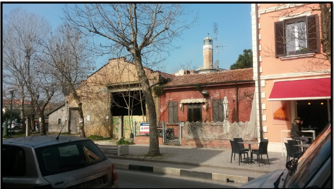
Immagine fotografica nr. 02: altra vista frontale sul viale Nazario Sauro