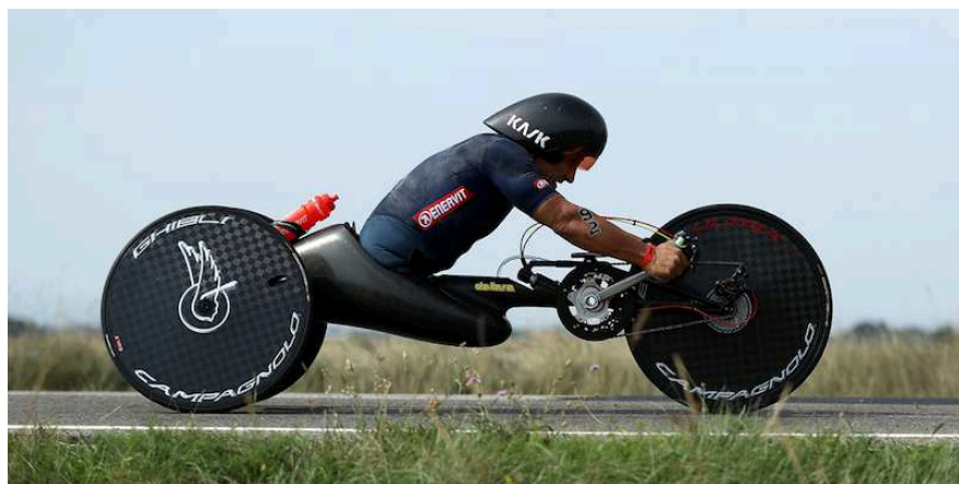
Alex Zanardi in gara

Domenica 23 Settembre 2018 - Romagna Faentina