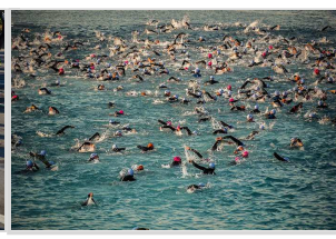
( http://www.dire.it/wp-content/uploads/2018/09/iron-man-2.jpeg )