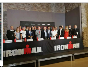
( http://www.dire.it/wp-content/uploads/2018/09/iron-man.jpeg )